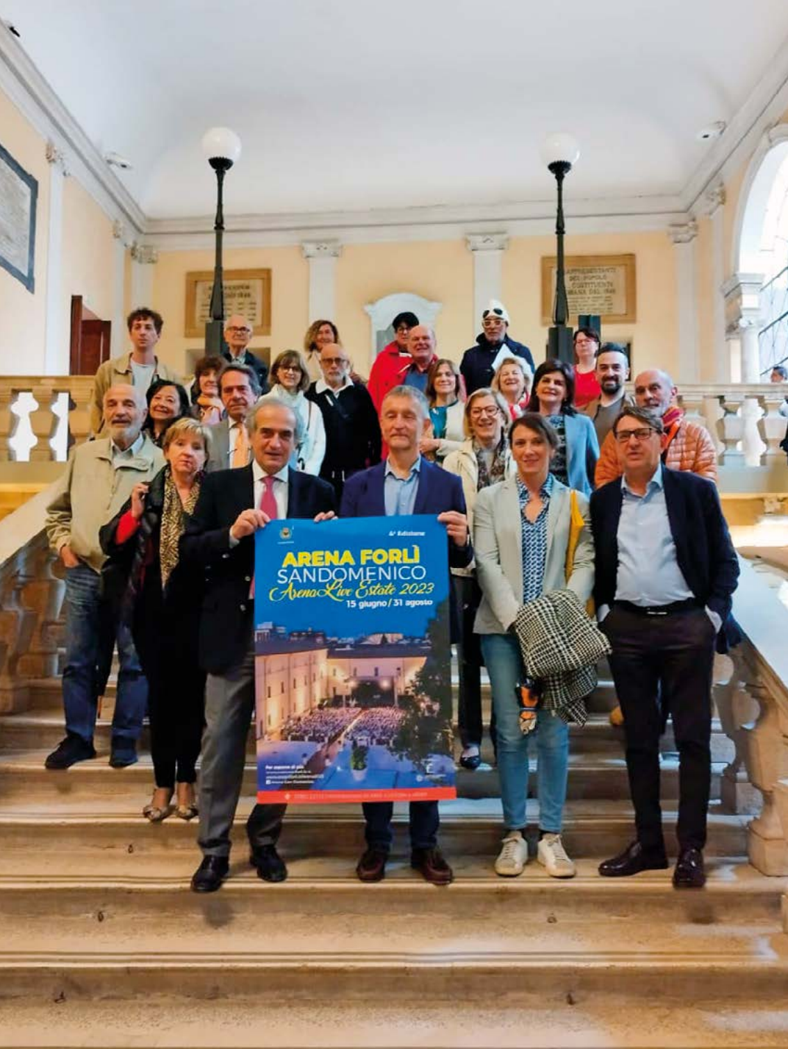
Momento della conferenza stampa con alcuni dei soggetti organizzatori presenti - 10 maggio 2023